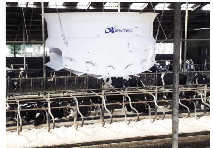
Diagram van de luchtstroomventilator